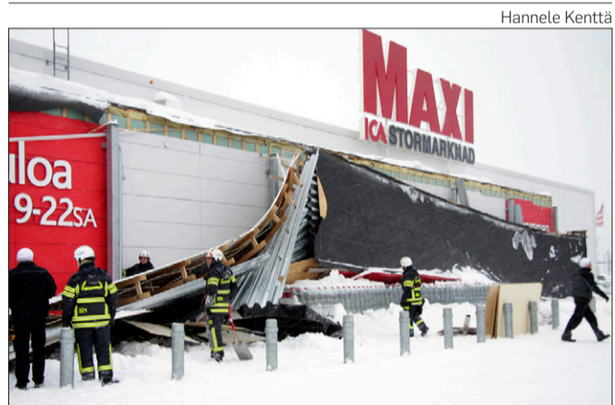
Palomiehet varmistivat, ettei Ica Maxin romahtaneen katoksen alle jäänyt ketään.